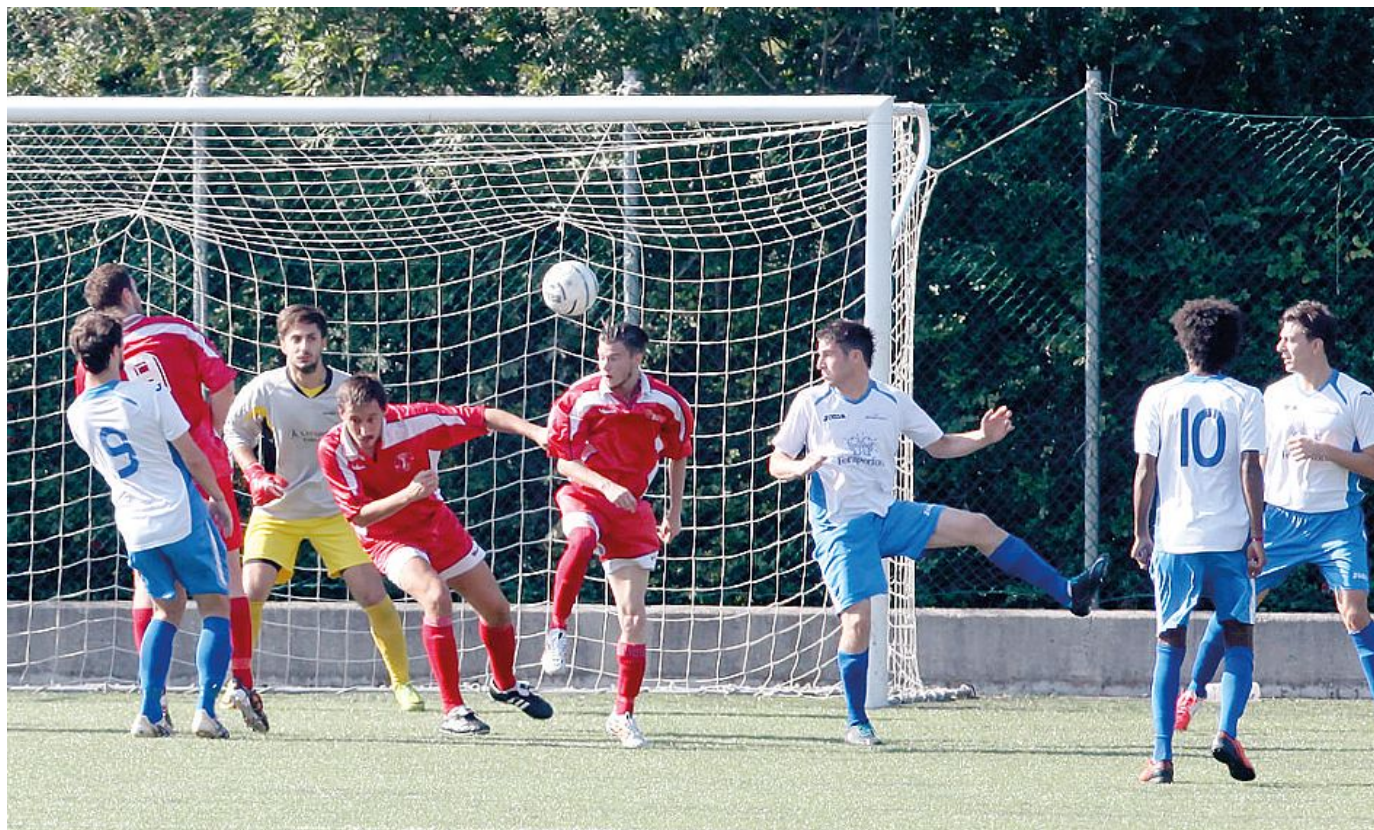
Una fase della partita tra il Breg e il Sant'Andrea San Vito