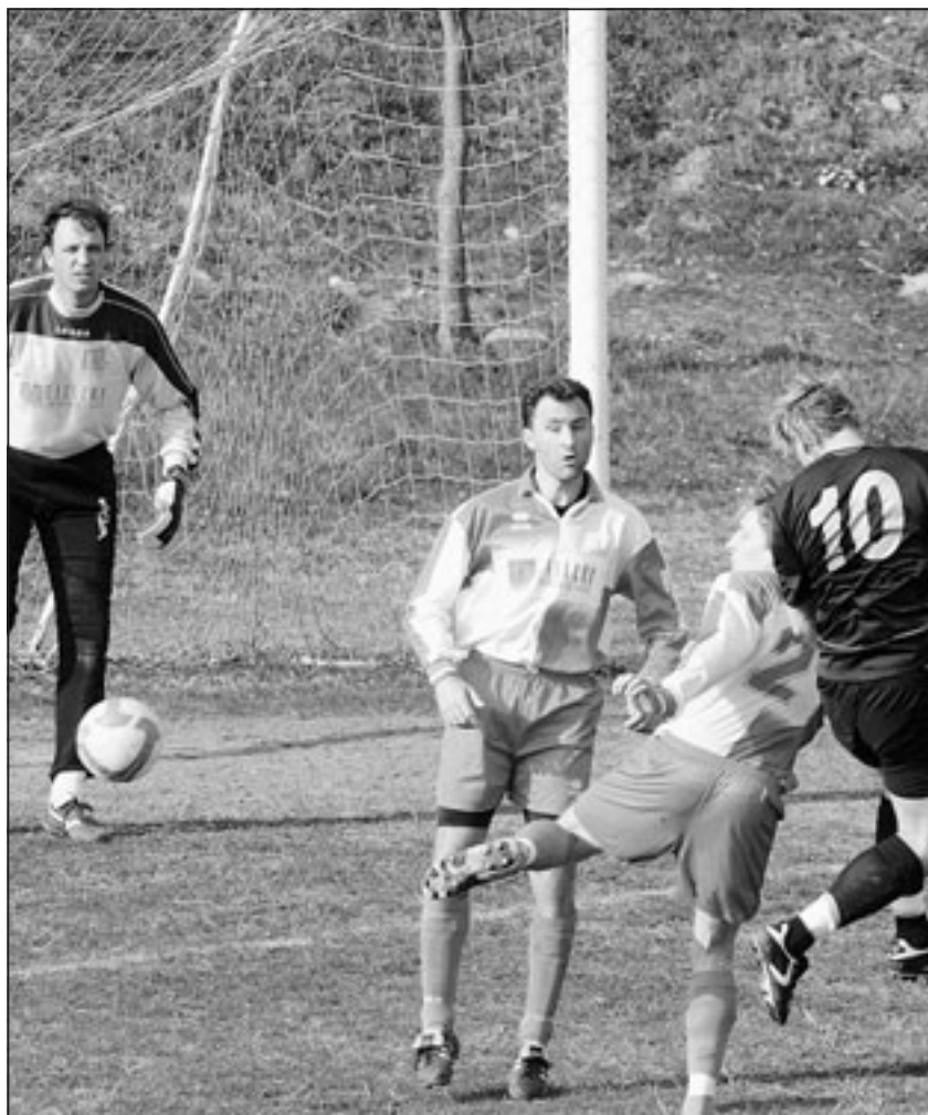
Un'accesa mischia in area