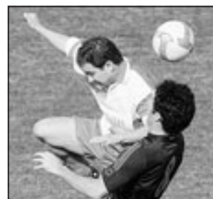
Gara molto fisica, come si vede anche nella foto